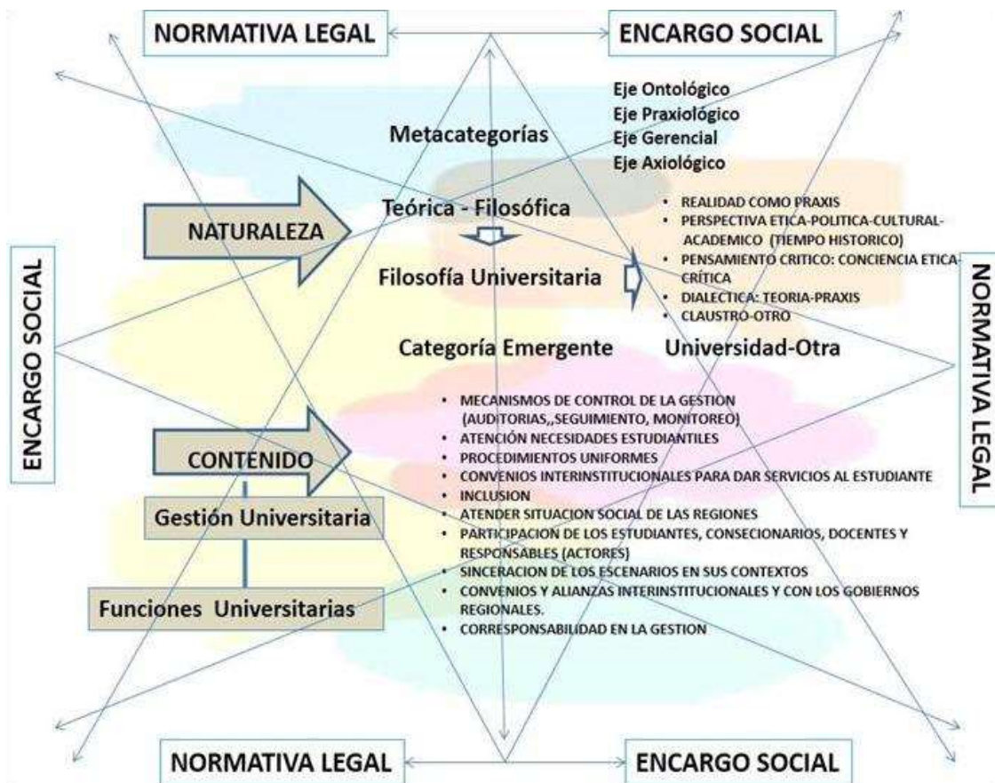
Figura Nro. 4 Asociación de categorías de acuerdo con su naturaleza y contenido