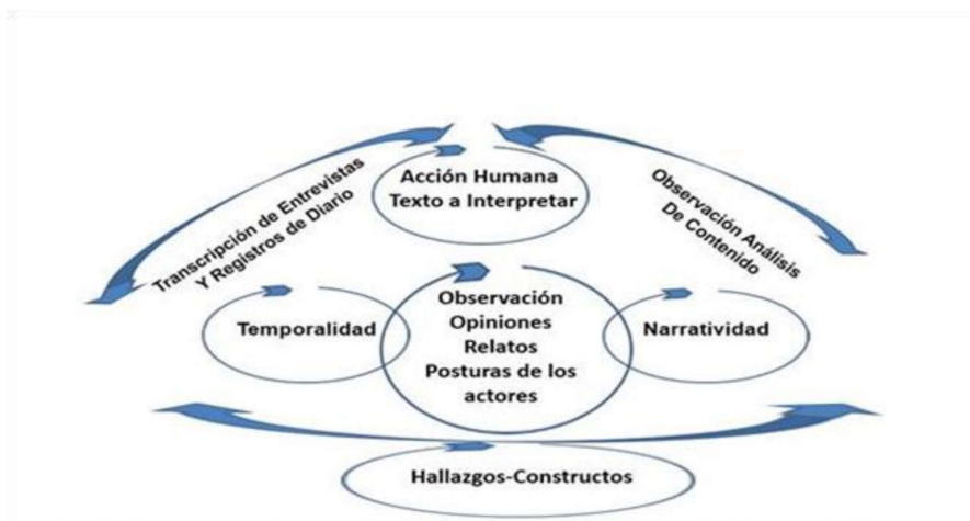
Figura Nro. 1.- Proceso de análisis del texto en base a la Hermenéutica-Dialéctica de Paul Ricoeur

El análisis e interpretación de la información se realizó siguiendo el paradigma crítico de Marx Horkheimer, con apoyo en la Hermenéutica-Dialéctica de Paul Ricoeur 28 ; con el propósito de rescatar los sujetos como protagonistas del proceso investigativo; la subjetividad es lo que espera rescatarse al investigar las decisiones estratégicas desde la hermenéutica de Ricoeur 29 :