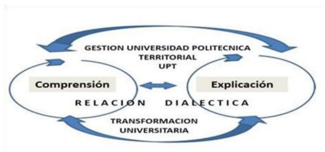
Figura Nro. 2. Metódica del Paradigma de la Interpretación de textos de Paul Ricoeur.

En términos de Ricoeur 30 , es “para” y no “de” porque la “polémica de explicar y comprender” es una nueva perspectiva, menos dicotómica y más dialéctica. No solo texto, sino historiografía y la praxis”, según la siguiente figura: